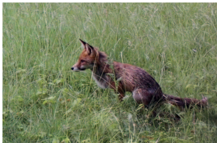
Auf jedem Friedhof gibt es mindestens einen Fuchs.

per Mail entgegen (OasenDerVielfalt@gmail.com). In diesem Fall ist es hilfreich, wenn neben dem Ort auch das Aufnahmedatum und der Zeitpunkt mitgeteilt werden.