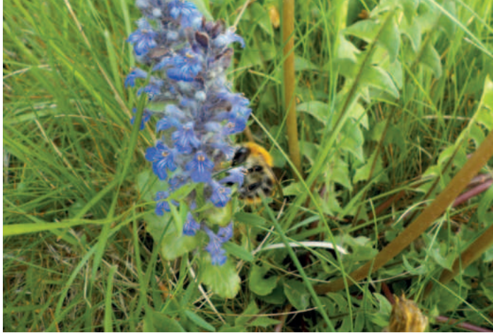
Wenn es blüht, summt und brummt es auf den Friedhöfen.

Statt wie ursprünglich geplant im Jahr 2023 soll der Baustart jetzt in diesem Frühjahr erfolgen. Wobei die Stadt auch hier gleich wieder ein bisschen auf die Bremse tritt. „Ein genauer Termin kann noch nicht genannt werden und ist unter anderem abhängig von der Auftragslage der zu beauftragenden Firmen und den Wetterverhältnissen“, so Schremser.