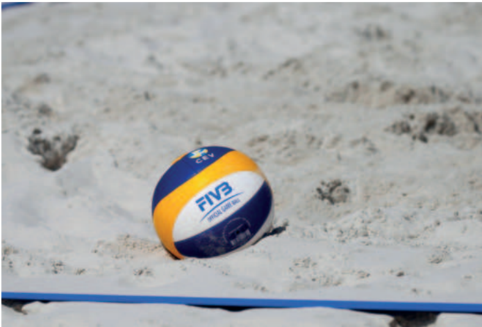
Concordia Wiemelhausen hofft auf ein Sponsoring, um einen weiteren Beachvolleyball-Platz zu bauen.

Diese Projekte aus unseren Stadtteilen hoffen auf ein Sponsoring