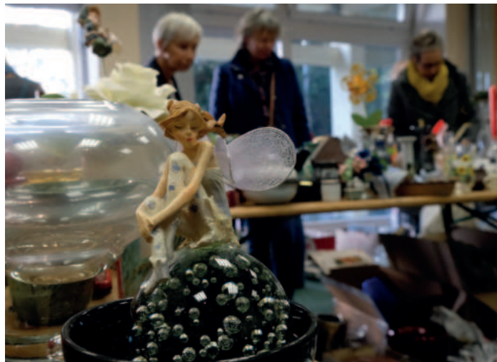
Zieht immer viele Besucher an: Der Flohmarkt im Hospiz St. Hildegard.