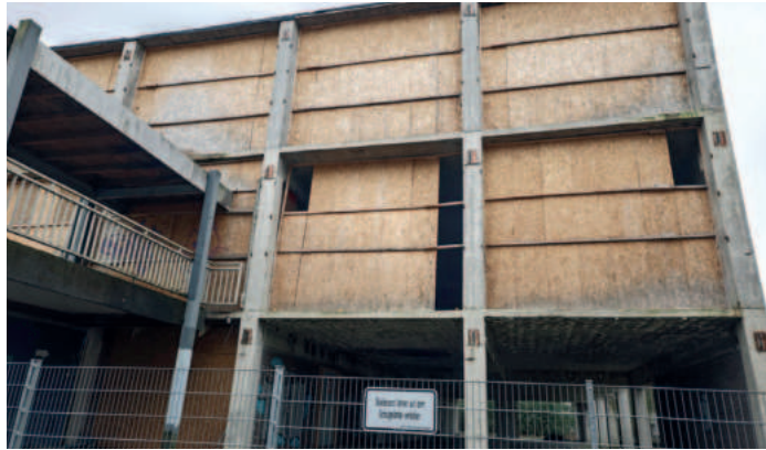
Kein schöner Anblick: Der sogenannte Kubus zwischen NGB und Hans-Böckler-Realschule.

Der Rat der Stadt hat den Sanierungsmaßnahmen im Oktober 2024 zugestimmt und auch die entsprechenden Gelder bereitgestellt. Insgesamt stehen 25 Millionen Euro zur Verfügung.