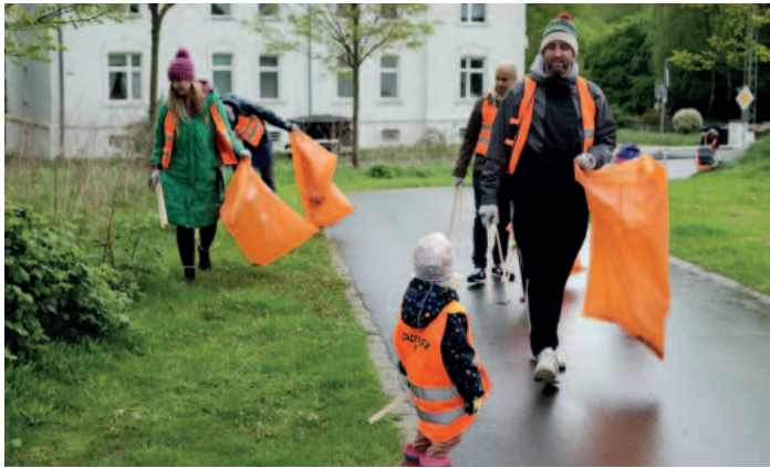
Familien und Co. sind zum „Frühjahrs-Stadtputz“ aufgerufen.