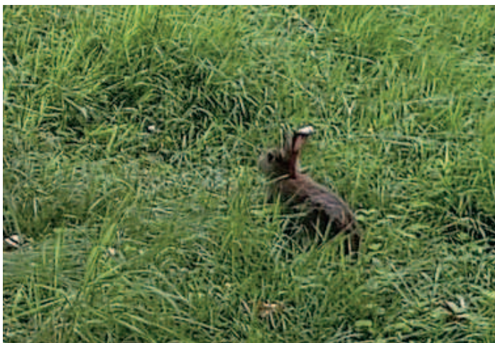
Auch Hasen lassen sich oft beobachten.

Die Teilnehmer treffen sich am Haupteingang. Sollte das Wetter an diesem Tag nicht mitspielen, wird die Führung auf den 17. Mai verschoben. Mitmachen kann wirklich jeder. Wünschenswert wäre, wenn alle eine eigene Taschenlampe mitbringen könnten.