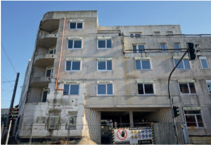
Plötzlich war das Gerüst weg.

An der Bauruine musste das Gerüst weichen