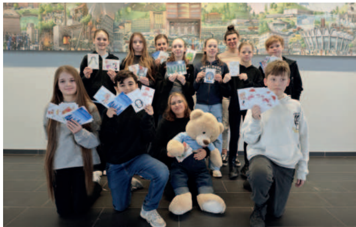
Sie haben gemalt, verkauft und gespendet: Schülerinnen und Schüler der Hans-Böckler-Realschule.

Was so traurig klingt, sieht in der täglichen Arbeit allerdings oft anders aus. „Wir wissen natürlich, dass die Eltern sich mit der Frage