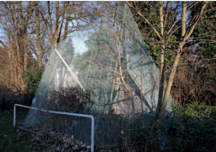
Ein trauriger Anblick: Die leere Voliere am „Haus am Glockengarten“.

Dieser Ort war einst ein beliebtes Ziel für Spaziergänger. Jahrelang hat die Voliere vor dem „Haus am Glockengarten“ zum Verweilen eingeladen. Doch der Glanz früherer Zeiten ist längst verblasst. Die Tage des Vogelhauses sind gezählt.