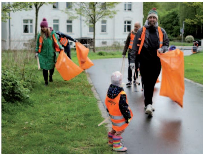
Familien und Co. sind zum „Frühjahrs-Stadtputz“ aufgerufen.

Mitmachen kann jeder, ob Privatperson, Verein, Institution oder Firma. Wo aufgeräumt wird, entscheidet auch jeder selbst – wichtig ist nur die vorherige Anmeldung: www.usb-bochum.de/stadtputz .