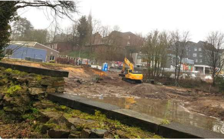
Im „Dahlhauser Dreieck“ sind die Bagger angerückt.

Arbeiten für den Erweiterungsbau – Anmeldungen schon jetzt