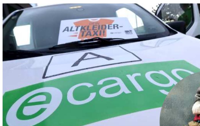
Das Altkleider-Taxi des USB und e-Cargo.

nern werden die ausrangierten Jacken, Hosen, Pullis & Co. anschließend in Sortieranlagen gebracht und weiterverwertet. Wichtig ist daher, dass ausschließlich gut erhaltene Kleidung zur Abholung gegeben