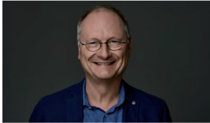
Meteorologe Sven Plöger ist zu Gast in Linden.

Der bekannte Meteorologe und Buchautor ist an diesem Abend im Gemeindesaal an der Hattinger Straße 814 zu Gast. Der Experte erläutert verständlich, wie das Klimasystem funktioniert, wie man skeptischen Stimmen begegnet und dass die aktuelle Krise eine echte Chance sein kann, die Weichen für