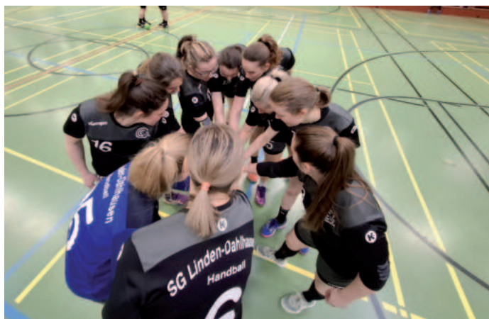
Die Handballerinnen brauchen spielerische Unterstützung.

Li-Da -Handballerinnen suchen Mit-Spielerinnen