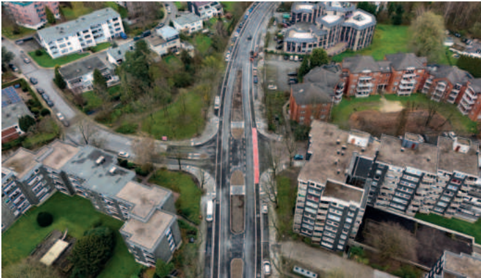
Neuer Radweg: Von der Semperstraße bis zur Hanielstraße.

Wer mit dem Fahrrad von der Königsallee über die Markstraße zum ehemaligen Opel-Gelände fahren möchte, ist nun ein ganzes Stück sicherer unterwegs. Auf und neben der Fahrbahn gibt es nun einen durchgehenden Radweg.