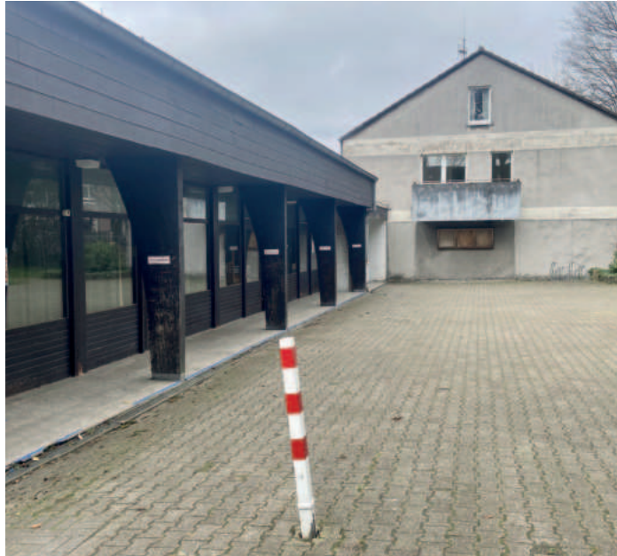
Auf diesem Grundstück soll das neue Gebäude entstehen.

Die Pläne für das Stadtteilzentrum sahen bekanntlich so aus: Die katholische Kirche verpachtet das Grundstück ihres bisherigen Gemeindezentrums an einen Investor. Der baut darauf ein Wohn- und Geschäftshaus, in das später auch das Stadtteilzentrum einziehen sollte.