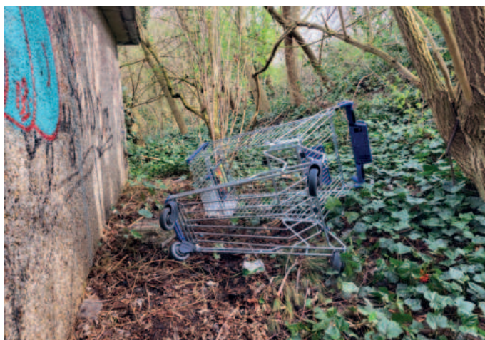
Verschandeln das Stadtbild: Entwendeter und achlos entsorgter Einkaufswagen im Gebüsch.