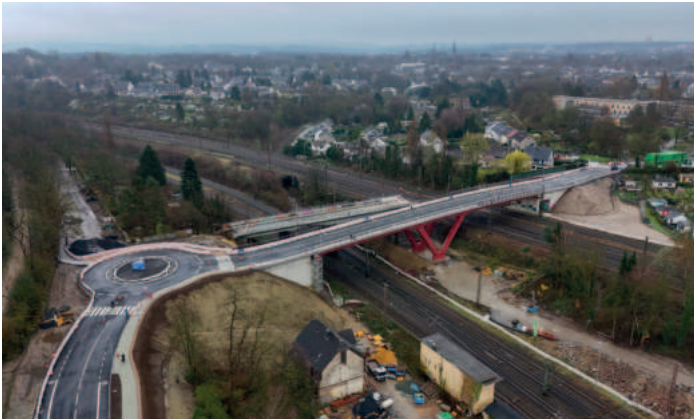
Neu und alt: Ein Teil der ehemaligen Lohringbrücke muss noch abgerissen werden.

Zwei Jahre lang wurde gebaut, im März hat Oberbürgermeister Thomas Eiskirch die neue Lohringbrücke für den Verkehr freigegeben. Und sie ist auch tatsächlich etwas Besonderes geworden. Die neue Brücke ist 102 Meter lang, 15 Meter breit und schwebt rund 17 Meter über den darunterliegenden Gleisen. Die Einzigartigkeit liegt