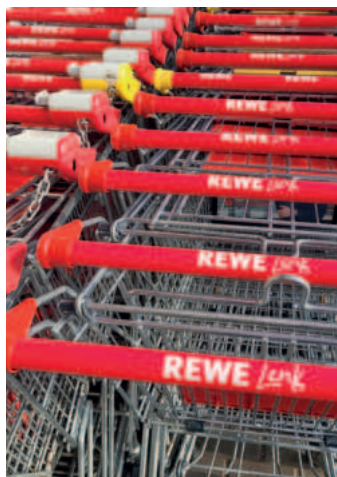
Sauber aufgereiht: Einkaufswagen bei Rewe-Lenk.