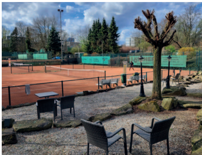
Im Vordergrund: Die neuen Allwetterplätze an der Paulstraße.

Ursprünglich hatte man bei der Tennisgemeinschaft sogar mit dem Bau einer Traglufthalle geliebäugelt. Die Idee wurde aufgrund der Energiekrise je-