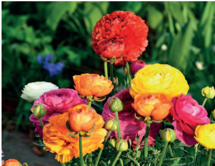
Farbenfrohe Ranunkeln: Sie können bereits jetzt eingepflanzt werden.

Tipps für den Frühling vom Gartenexperten