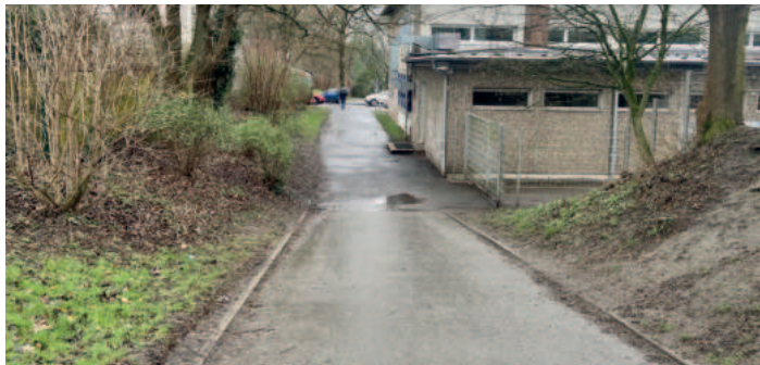
Der Verbindungsweg ist weiterhin schlecht beleuchtet.

Auch zwei Jahre nach der Vor-Ort-Berichterstattung über den schlecht beleuchteten Verbindungsweg zwischen der Turnhalle der Vels-Heide-Schule und der Wasserstraße sind die versprochenen drei neuen Laterne nicht installiert. Jetzt ist aber zumindest wieder Bewegung in den Fall gekommen.