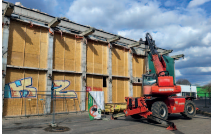
Dacharbeiten: Ende März wurden Teile des alten Bauwerks abgerissen und entsorgt.

Wer die Fotos von 2014 und 2024 vergleicht, sieht zwar immer noch kaum einen Unterschied: Die Fensteröffnungen sind mit Brettern verrammelt, alle Eingänge versperrt. Doch dann wurde plötzlich der Lehrerparkplatz der Hans-Böckler-Schule verlegt, später kam ein Teleskoplader.