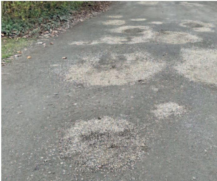
Die Buckelpiste stört die Politik und den Verein.

Aktuell hat das auch die SPD-Fraktion im Rat noch einmal getan. Die Verwaltung sol-