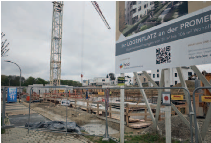
Eine der Baustellen auf dem Ostpark-Gelände.

Quartier Feldmark wird frühestens 2029 fertig