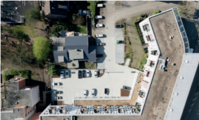
Alles neu: Blick auf die sanierte Parkfläche.

Die Sanierung der Parkflächen hinter dem „Altenbochumer Bogen“ durch die VBW Bauen und Wohnen GmbH ist abgeschlossen. Die 56 Stellplätze stehen den Kundinnen und Kunden der ansässigen Gewerbetreibenden nun wieder zur Verfügung. Die Arbeiten hatten sich in die Länge gezogen, weil festgestellt worden war, dass die Park-