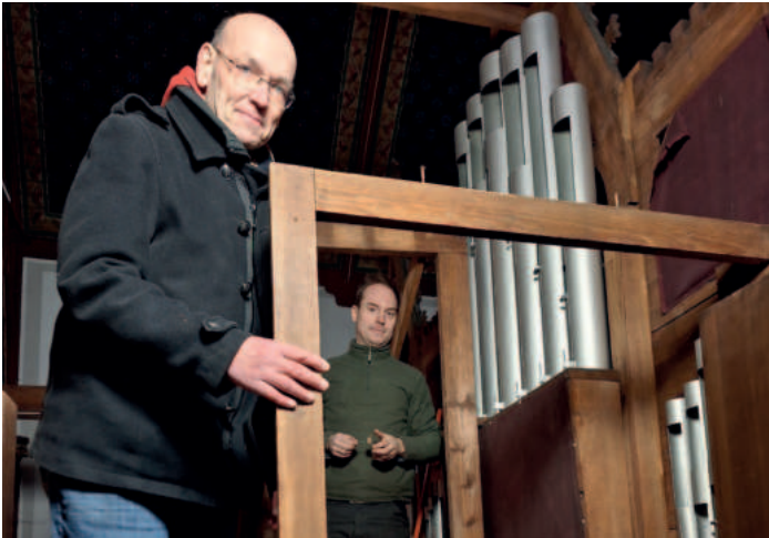
Der Orgel-Sachverständige während der Sanierungsarbeiten.

Jedes Jahr im Mai feiert die Stiftung Lukaskirche ein Fest für alle Freunde, Förderer und Gemeindeglieder. In diesem Jahr findet die Veranstaltung in einem besonders feierlichen Rahmen statt.