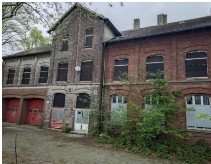
So sieht das Gebäude an der Alten Wittener Straße aus.

Natürlich hat der Zahn der Zeit ordentlich an der alten Feuerwache genagt. Und das nicht erst,