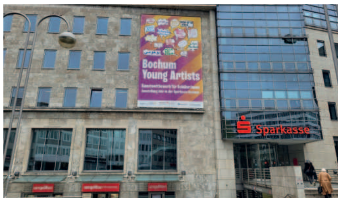
Die Bilder sind zuerst in der Hauptstelle der Sparkasse Bochum zu sehen. Auch VorOrt unterstützt den Wettbewerb.

Die Idee kommt aus Bochums Partnerstadt Sheffield. Dort gibt es den Wettbewerb unter dem Namen „Sheffield Young Artists“ schon seit über 20 Jahren. Vor vier Jahren wurde er vom Rotary Club Bochum-Renaissance in abgeänderter Form nach Bochum