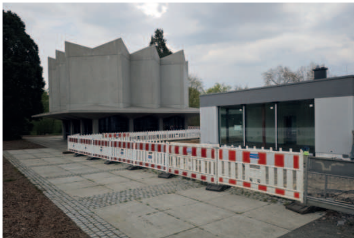
Fast Fertig: Das Fritz-Bauer-Forum.

Fast vier Jahre sind seit der Grundsteinlegung vergangen. Jetzt wird das Fritz-Bauer-Forum feierlich eröffnet. Vom 22. bis zum 24. Mai sind zahlreiche Veranstaltungen geplant. Als Bochumer Zentrum für Demokratie und Menschenrechte will sich das Forum als Ort der Bildung und Ort der Begegnung präsentieren.