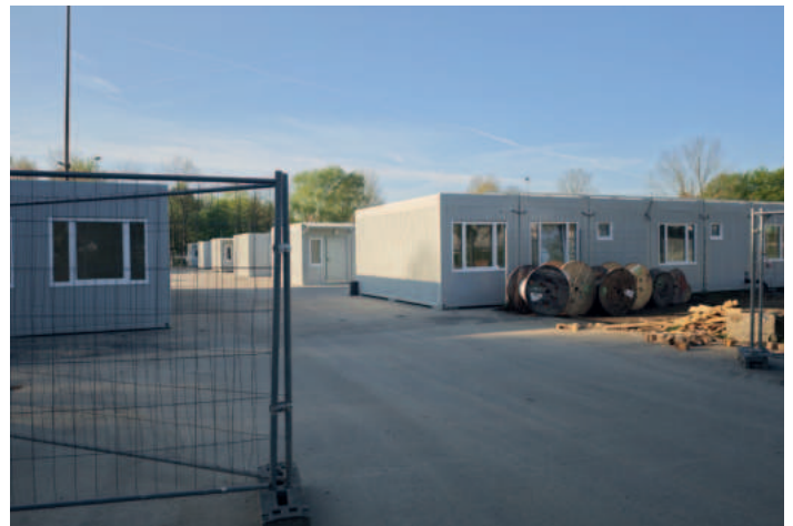
Die Container stehen schon bereit.

Altenbochums Einwohnerzahl soll noch im Mai um 300 wachsen. Auf der Multifunktions- und Krisenfläche „Auf der Heide“ sollen schon bald wieder geflüchtete Menschen einziehen.