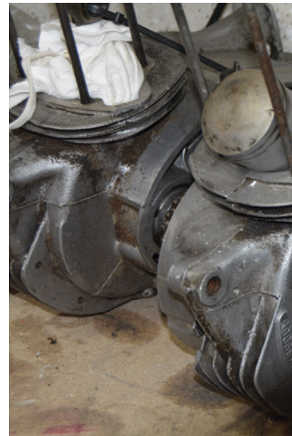
Von Hercules bis MZ: Der Fuhrpark der fünf Freunde ist ein echter Hingucker.

Diesen Jungs macht so leicht keiner was vor. Sie tunen Mopeds, zerlegen Motoren und haben schon ihr eigenes Racing-Team. Dabei sind die jüngsten Nachwuchsschrauber erst zwölf Jahre alt.