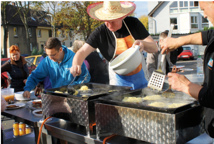
Immer ein Erfolg: Das Fest der Altenbochumer Hilfsorganisation.

Aktion Canchanabury feiert am 24. Oktober wieder die Kartoffel-Fete