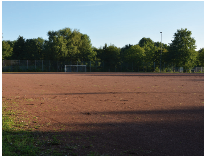
Hier sollen im nächsten Jahr Container für Flüchtlinge stehen.

„Es ist eine Selbstverständlichkeit, dass wir die Einwohner unseres Stadtteils umfassend informieren und einbinden“, verspricht die Altenbochumer Ratsfrau Simone Gottschlich. Von Schnellschüssen und blindem Aktionismus hält die Sozialdemokratin jedoch nichts. Sollte es bei dem derzeitigen Zeitplan bleiben, der die Aufstellung der Container Ende Januar 2016 vorsieht, „werden wir irgendwann