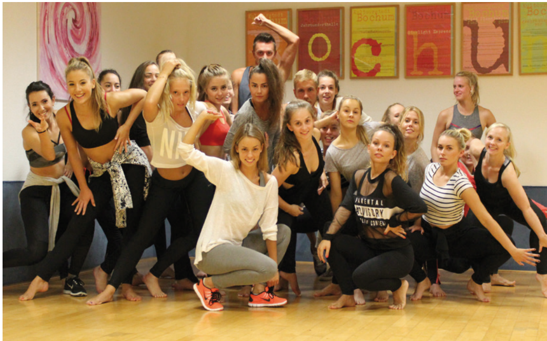
Gut vorbereitet für die Weltmeisterschaft im Bochumer RuhrCongress.

Disco-Dance-Formation des T.T.C. Rot-Weiß-Silber greift erneut nach dem WM-Pokal