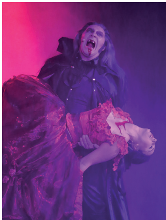
„Die Schöne und das Biest.“

Überhaupt kommen viele Musical-Helden ins Rampenlicht: Zum Beispiel Buddy Holly im paillettenbestickten roten Jackett. Den letzten Akt bilden die schrillen Transvestiten aus der „Rocky-Horror-Picture-Show“ an einem Abend voller Sehnsucht, Träume und starken Gefühlen. Buchungen: info@la-posta.de oder 546 44 32. Der nächste Termin: 17. April.