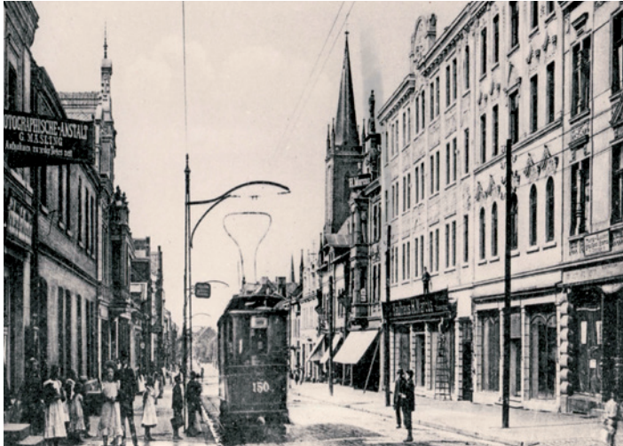
Das frühere Kaufhaus Marcus (re.).

Die wechselvolle Geschichte eines stolzen Gebäudes – Warten auf den Supermarkt