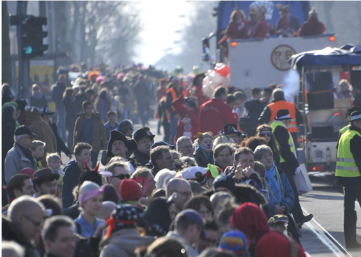
Nach der Absage im Februar soll der Lindwurm diesmal rollen.

Beim Rosenmontagszug - Das alte Motto bleibt