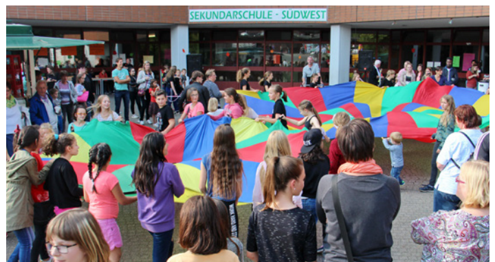
Beim Schulfest an der Dr.-C.-Otto-Straße war jede Menge los.

Hattinger Straße 875-885, 44879 Bochum, Tel. +49 234 942050, http://www.volkswagen-autohaus-wicke.de