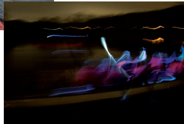
Wenn Licht und Schatten verschwimmen: Die Drachenbootler machen ihre Touren bei Dunkelheit.

Die „Allstars“ fahren den Winter-Cup, an dem auch die Stand-Up-Paddler teilnehmen. Für die sind die dunklen Monate kein