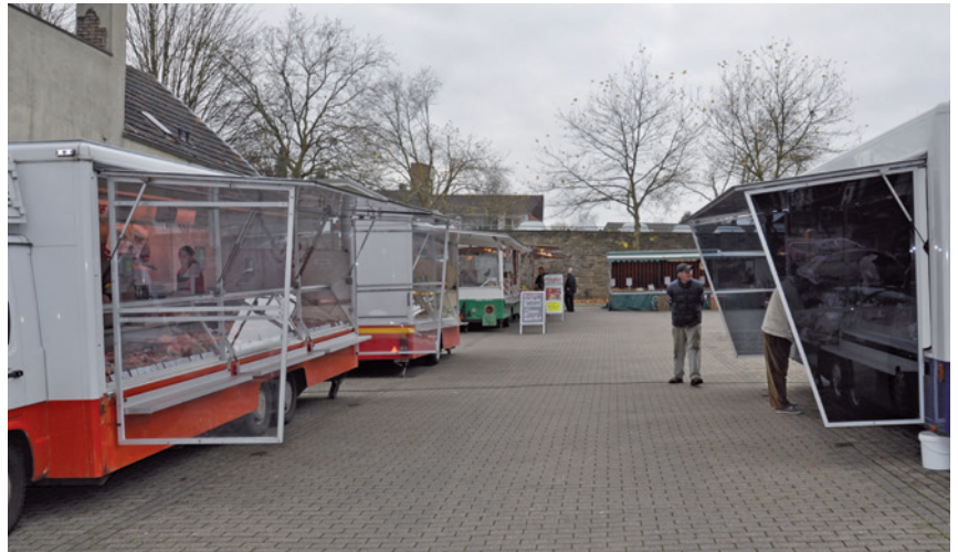
Bietet unter der Woche eher ein trostloses Bild: Der Lindener Markt.

die Märkte unwirtschaftlich werden. Eine Privatisierung der Märkte soll Abhilfe schaffen. „Private Anbieter haben ganz andere Marketing- und Umsetzungsmöglichkeiten, als das Ordnungsamt, welches derzeit für die Märkte zuständig ist“, teilt die Stadt Bochum auf Anfrage mit. Somit ließe sich die Attraktivität der Märkte und gleichzeitig die Wirtschaftlichkeit steigern. Mehr Besucher und mehr Stände bedeuten einen höheren Gewinn. Auch neue Konzepte sind gefragt, um