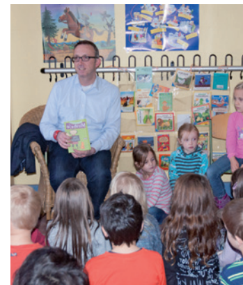
Gräf inmitten von Kindern.

Mit einer Lese-Kettenreaktion nahm die Grundschule Dahlhausen am bundesweiten Vorlesetag teil. Für den Südwesten gab Bezirksbürgermeister Marc Gräf mit einer Vorlesestunde in der Schulbücherei für die Klassen 1 und 2 den Startschuss. In einem gemütlichen Sessel und inmitten gespannter Grundschulkinde las Gräf aus dem Buch „Mirabelle“, welches er eigens ausgesucht hatte. In diesem Buch schildert die kleine Mirabelle große und kleine Erlebnisse aus ihrem Schulalltag. Geschichten, in denen jedes Kind sich wiederfindet. So hingen denn auch die Dahlhauser Kinder gebannt an den Lippen des Bezirksobershauptes. „Lesen soll Spaß machen, und deshalb habe ich die charmante Geschichte von Mirabelle ausgesucht“, betont Gräf, der auch als Familienvater großen Wert auf das Lesen legt. Munter und mit sichtlichem Vergnügen wurde die Vorlesestunde zu einem kurzweiligen, spannenden Erlebnis, an deren Ende ein vielstimmiges „Dankeschön“ zu hören war. Das Angebot, an den Schulen zu lesen, stammt von Gräf selbst. „Leider haben sich nur zwei Schulen gemeldet, aber das Angebot gilt auch weiterhin. Interessierte Schulen können sich gerne melden.“