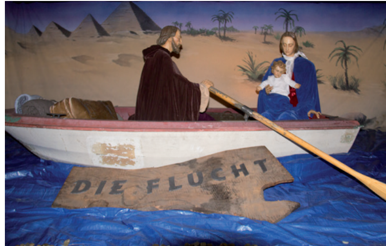
Die neueste Kreation des Krippenvereins.

animieren, weiter Hilfe zu leisten: „Die heilige Familie ist doch der Prototyp der Flüchtlingsfamilie. Vor über 2.000 Jahren mussten sie nach Ägypten fliehen, um zu überleben. Jetzt kommen die Menschen zu uns. Sie fliehen um ihr Leben. Da sind wir gefordert.“ Das neuste Werk des Krippenvereins ist beeindruckend, aber nur eines von insgesamt über 250 eigens geschnitzten oder international gesammelten Highlights aus 55 Ländern, die in der Ausstellung bis zum 22. Dezember zu sehen sind. Anmeldung zur Gruppenführung: 49 22 80. Am 5. (14 bis 18 Uhr) und 6. Dezember (13 bis 17 Uhr) findet außerdem ein Verkauf von Krippen und Figuren zugunsten der Vereinsarbeit statt.