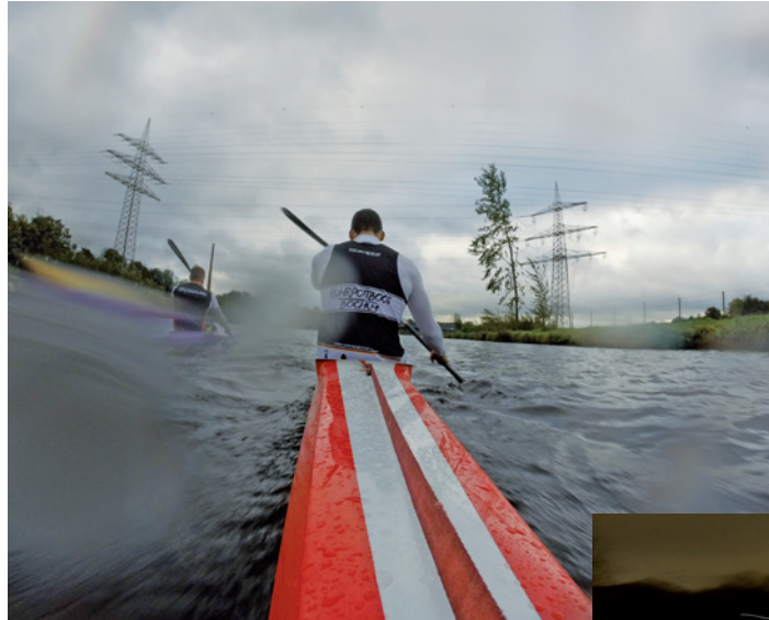
Im Boot bei Wind und Wetter.

Bestes Beispiel sind die Drachenbootportler des LDKC. Die „Allstars“ treffen sich zweimal die Woche zu einer 10-Kilometer-Tour. Im Winter bedeutet das: Fahren durch die Dunkelheit. „Wenn es klar ist, spiegeln sich der Mond und die Sterne auf der