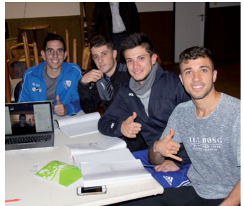
Oben die Sportfreunde vergangener Zeiten, unten vier der Landesliga-Spieler beim Sprachunterricht im Vereinsheim.