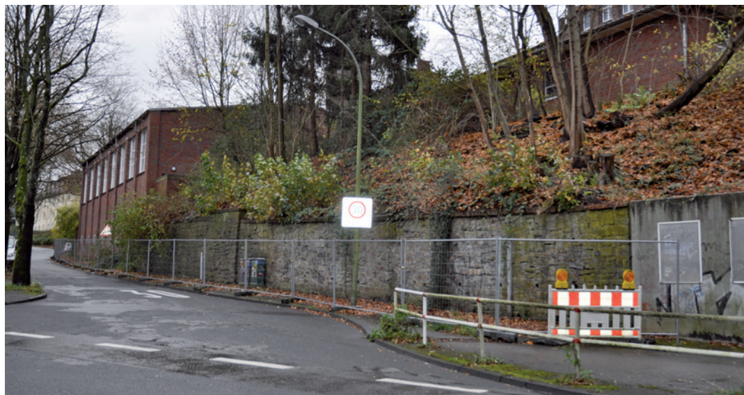
Wie diese Mauer langfristig gesichert werden kann, soll ein Gutachter herausfinden.

Bereits seit Mai sind die Bruchsteinmauer und der dazugehörige Gehweg unterhalb der Dahlhauser Grundschule durch hohe Bauzäune gesichert. Und das stellt für viele Verkehrsteilnehmer ein Hindernis dar. „Es sind Ausbeulungen in der Mauer zu erkennen und es könnten Steine herausbrechen“, so ein Sprecher der Stadt zum Grund der Sperrung. Nachdem bereits einige Überprüfungen durchgeführt wurden, soll jetzt ein statisches Gutachten Klarheit bringen, wie die Mauer langfristig gesichert werden kann. „Der Auftrag wird in Kürze vergeben“, so der Stadtsprecher weiter.