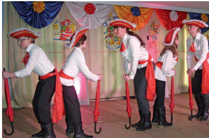
Beim Eppendorfer Karneval geht's immer bunt zu.

Die zweite Premiere: Die Mädchengruppe „Funky Smileys“ tritt auf. Sie folgt auf das Duo „Vater und Vater“, das nach 15 Jahren aus gesundheitlichen Gründen nicht mehr auftritt.