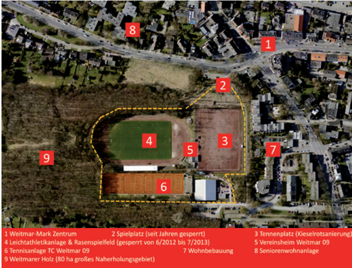
So sieht es aktuell aus...

Aber die Pläne für einen „Erbstollen-Park“ stoßen auf Widerstand