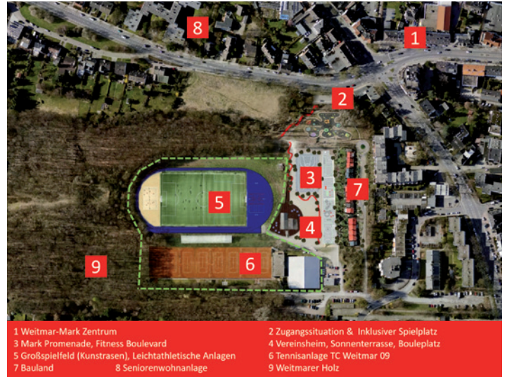
...und so soll es bei Weitmar 09 bald aussehen.

Höher, weiter, schneller - bei Blau-Weiß Weitmar 09 haben die Vereinsverantwortlichen ehrgeizige Ziele. Die in die Jahre gekommene Bezirkssportanlage an der Roomersheide soll zu einer multifunktionalen Sportanlage umgebaut werden, mit Kunstrasenplatz, Laufbahn, Fitness-Boulevard, Spielplatz, Promenade, Sonnenterrasse und und und. „Wir haben den Anspruch, etwas Anspruchsvolles aufzustellen und zwei Hektar Land in allerbesten Lage für ganz Weitmar-Mark nutzbar zu machen“, sagt der 2. Vereinsvor-