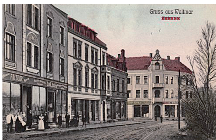
Die Markstraße um die Jahrhundertwende.

Markstraße (heute Karl-Friedrich-Straße, die Umbenennung erfolgte am 7.5.1926 mit der Eingemeindung). Auf der linken Seite ist der Abzweig in die Neulingstraße. Zu sehen sind die Hausnummern 104, 102, 100 und das Eckhaus 98. Die Fassaden sind mit den heutigen noch identisch.