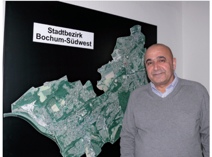
Der Linken-Politiker Wahed Tofik engagiert sich im Südwesten.

„Ich bin während des Iran/Irak Krieges 1982 selbst als Flüchtling nach Deutschland gekommen“, erzählt er, „ich weiß, wie es diesen Menschen geht, was sie bewegt und wie schwierig die Anfangszeit in einem fremden Land ist.“ Tofik spricht kurdisch, persisch und arabisch – „damit decke ich den ganzen Orient ab“, sagt er mit einem Augenzwinkern und berichtet von Verzweiflung, traumatisierten Kindern und emotionalen Momenten, die ihn sichtlich tief berühren. „Diese Stadt hat mir selbst sehr viel gegeben“,