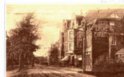
Hattinger Str. / Franciskusstr.

Ausstellung über den Wandel der Gemeinde Weitmar, anhand von Karten, historischen Aufnahmen, alten Inseraten und Briefköpfen.