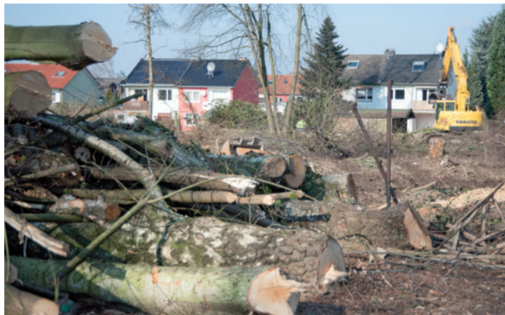
Die Fläche ist gerodet, bald werden hier Häuser gebaut.

An der Bäreendorfer Straße soll endlich gebaut werden