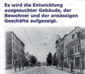
Hattinger Str. / Kohlstr.

Rahmenprogramm der Ausstellung, jeweils 18:00 Uhr: