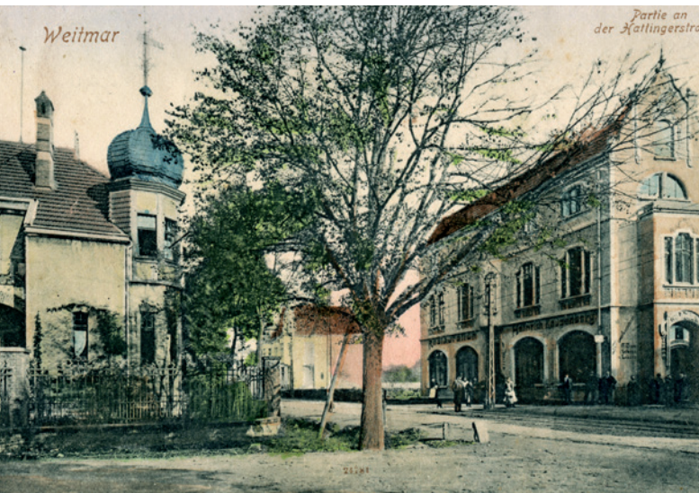
Das Haus Kassenberg nach 1905 (rechts im Bild).

Weitmar seit dem 1. April 1926 ein Stadtteil Bochums