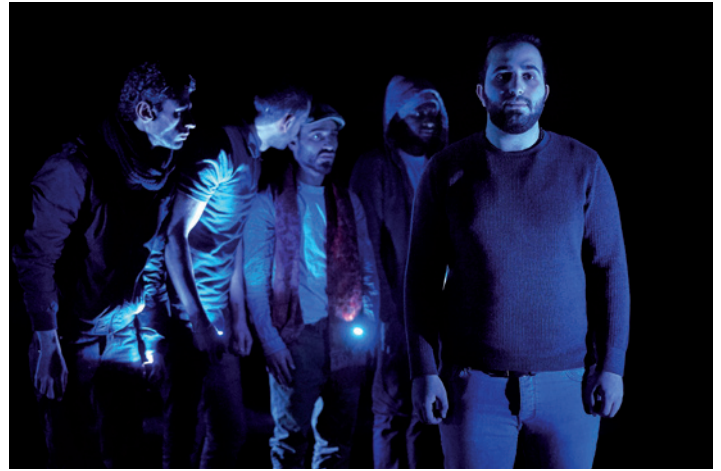
Grubengold feiert am 1. April Premiere.