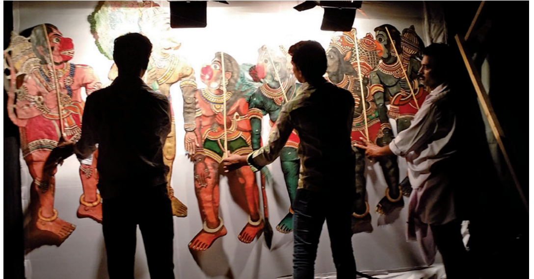
Schattentheater - eine der ältesten Kunstform.