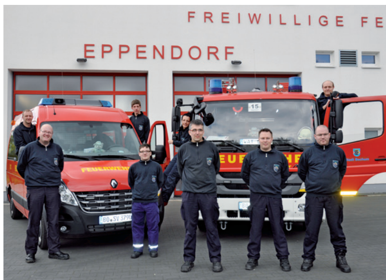
Die Eppendorfer Löscheinheit.

Der offizielle Festakt erfolgt einen Tag später. Nach der Kranzniederlegung am Ehrenmal geht es mit einem Umzug zurück zum Feuerwehrhaus. Anschließend ist eine Feierstunde in der Aula der Realschule geplant. Dort wird die Jubiläumsurkunde übergeben. Es folgen die Jubilarehungen