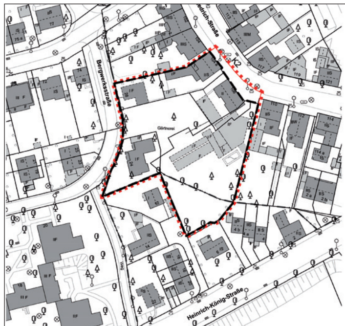
Der neue Entwurf der Verwaltung.

Darin heißt es unter anderem, dass der Supermarkt nun 1.500 qm Verkaufsfläche haben soll und weitere 500 qm als Shopping-Meile ausgewiesen werden. Auch weitere Auflagen wurden gekürzt oder ganz gestrichen. Und für die Gebietserweiterung des Marktes, womit die Grenzen des verbindlichen