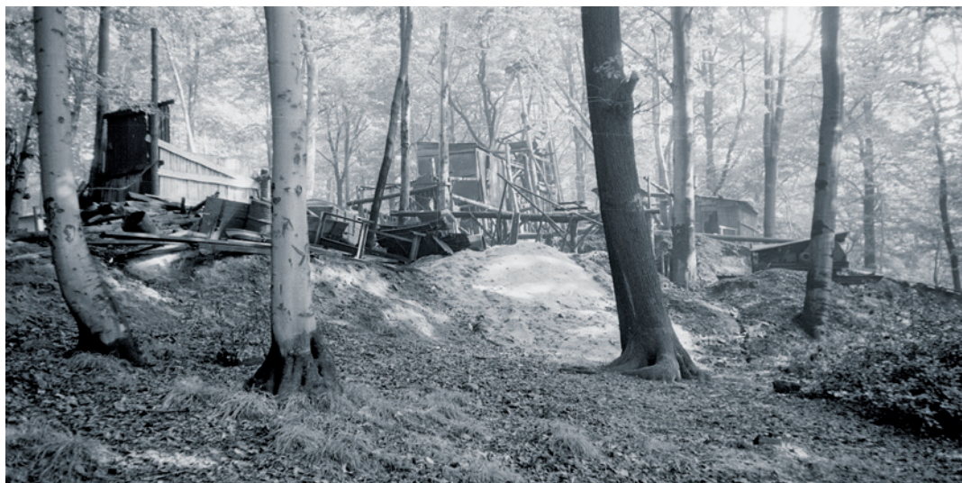
Eine Kleinzeche im Weitmarer Holz vor über 60 Jahren.

Tagesbruch im Weitmarer Holz – „So löchrig, wie Schweizer Käse“