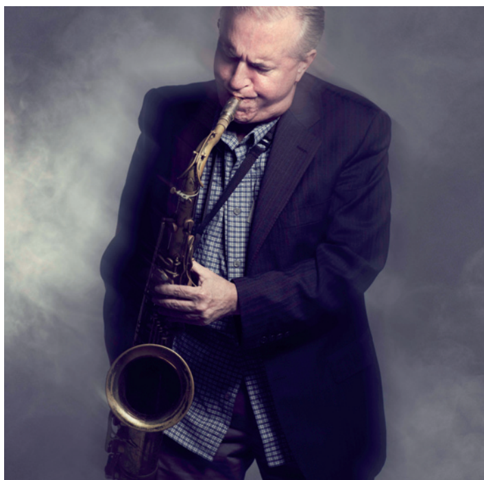
Scott Hamilton, ein Meister am Saxofon.