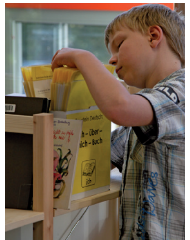
Der Baukasten enthält Lernmaterial.

Lehrer haben dazu eigenes Lehrmaterial erarbeitet, das in Bausteine gegliedert ist. Jedes Fach bekommt eine eigene Farbe (Deutsch ist gelb, Mathe ist blau und Englisch ist grün). Immer in den ersten beiden Stunden nimmt sich jeder Schüler das Material aus einem Baustein, sucht sich einen ruhigen Arbeitsplatz, der durchaus auch außerhalb des Klassenraumes liegen