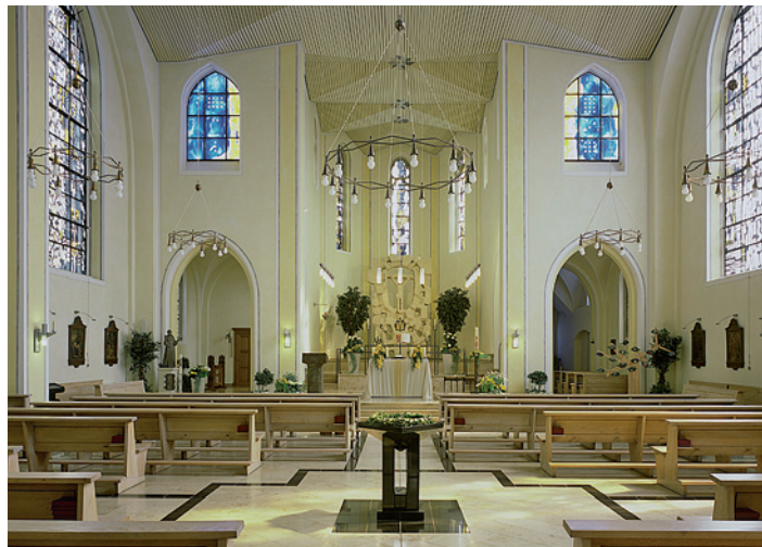
Die St. Franziskuskirche heute.

Im Laufe der Jahre wurden insgesamt vier Pfarreien aus der Franziskusgemeinde gegründet: St. Anna Weitmar-Nord (1916), St. Theresia Eppendorf (1933), Vierzehnheiligen (1947) und Hl. Familie (1959) - eigenständig ist heute keine mehr, andere mussten sogar geschlossen werden. Doch zurück zur anderen Ge-