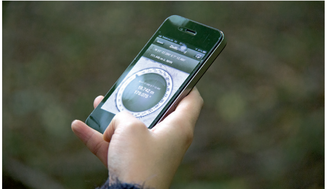
Auch mit dem Handy ist eine GPS-Suche möglich.

Beim Geocaching werden überall auf der Welt kleine Plastikbehälter versteckt und können anschließend von Dritten, mit Hilfe von geografischen Daten, gesucht werden. Die entsprechenden Koordinaten werden im Internet veröffentlicht. Vor der Suche, die nach Schwierigkeitsgrad und Terrain geordnet ist, muss meistens ein Rätsel gelöst werden. Die Kommentare der letzten Entdecker helfen, Schwierigkeiten zu überwinden.