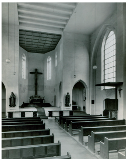
So sah es innen früher aus.

schichte: Die Kirche von St. Franziskus wurde bei einem großen Luftangriff im 2. Weltkrieg erheblich zerstört. Am 9. Oktober 1944 trafen zwei Bomben das Kirchenschiff, allerdings blieben Umfassungsmauern und Turm erhalten. Gottesdienste wurden zunächst im Schwesternhaus an der Wasserstraße gefeiert, später wurde in den Ruinen eine Notkirche errichtet.