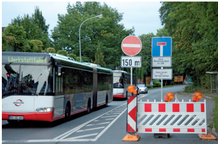
Noch bis Mitte November wird gebaut.