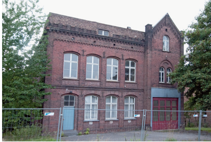
Das alte Feuerwehrhaus in Eppendorf.

Rückblick: Das über 100 Jahre alte Gebäude diente erst jahrzehntelang als Schule, dann fast 50 Jahre lang als Gerätehaus der Freiwilligen Feuerwehr. Doch seit einem massiven Wasserschaden im Februar 2012 im Obergeschoss ist das Haus nicht mehr nutzbar. Es besteht Einsturzgefahr.