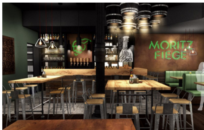
So soll der neue Hopfengarten einmal aussehen.

Fehlt nur noch der Pächter für das mehr als 300 Quadratmeter große Lokal. „Es ist schwie-