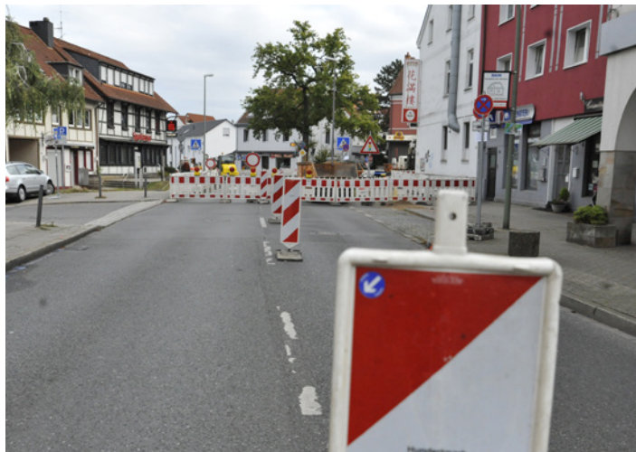
Straßensperrungen in Eppendorf-Mitte.

Die Geschäftsleute im Ortskern begleiten die Arbeiten mit einem weinenden und einem lachenden Auge. „Der Baulärm ist schon eine Beeinträchtigung“,