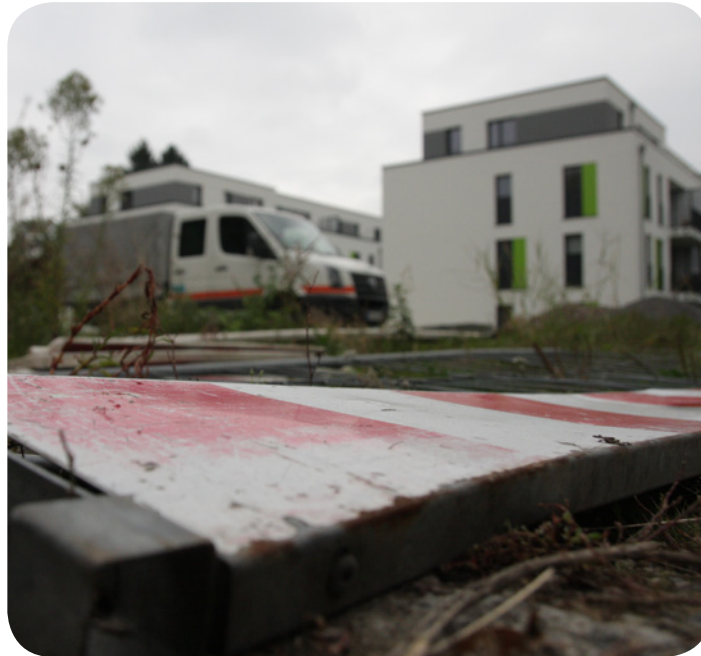
Liegt brach: Das Grundstück für das geplante Soziale Zentrum.

Allerdings ist der Bauantrag nach wie vor nicht eingereicht. Persönlich Stellung möchte Oelscher nicht beziehen – schließlich sei die Planung der Öffentlichkeit bereits vorgestellt worden, ließ er über die Pressestelle des Franz Sales Haus ausrichten. Ansonsten hüllt