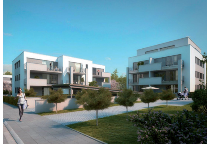
So soll es bald aussehen.

„Die Immobilien-Nachfrage in Bochum ist generell sehr groß“,