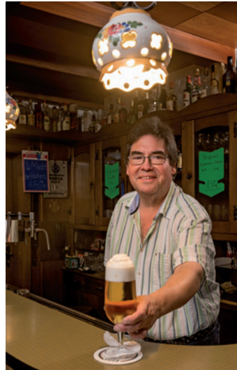
Das perfekte Pils...

Aufhören will der Wirt darum auch noch nicht. „Wenn ich etwas anfange, dann ziehe ich es auch durch“, sagt der 60-Jährige lachend, der ganz besonders stolz auf seine „stressfreie Kundenschaft“ ist, wie er betont. „In all den Jahren habe ich nur einmal die Polizei hier gehabt. Und das ist schon lange, lange her.“