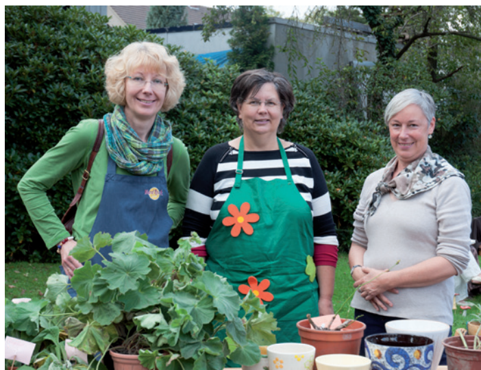
Ehrenamtliche Helferinnen verkauften die Pflanzen.

Neben dem Pflanzenangebot gab es aber noch mehr: Der Bastelkreis der Frauen bot außergewöhnliche Strick- und Wollsachen an, dazu gab es verschiedene Handtaschen - und für die Verköstigung hatte das Gemeinde-Café geöffnet. Zahlreiche ehrenamtliche Helfer stellten sich als Verkäufer hinter die vollgepackten Stände. Durch das Verkaufen der Pflanzen, Samen usw. werden nötige Gartenarbeiten des Gemeindehauses bezahlt bzw.