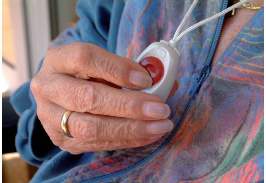
So sieht ein Gerät für den Hausnotruf aus.

Badewanne und kann als Armband an der Hand, als Kette oder als Clip am Revers getragen werden. Mit ihm wird im Notfall Alarm ausgelöst, der beim DRK einget. Dazu bekommen die Menschen ein Freisprechgerät, durch das sie in der Notrufzentrale ihre Situation schildern können.