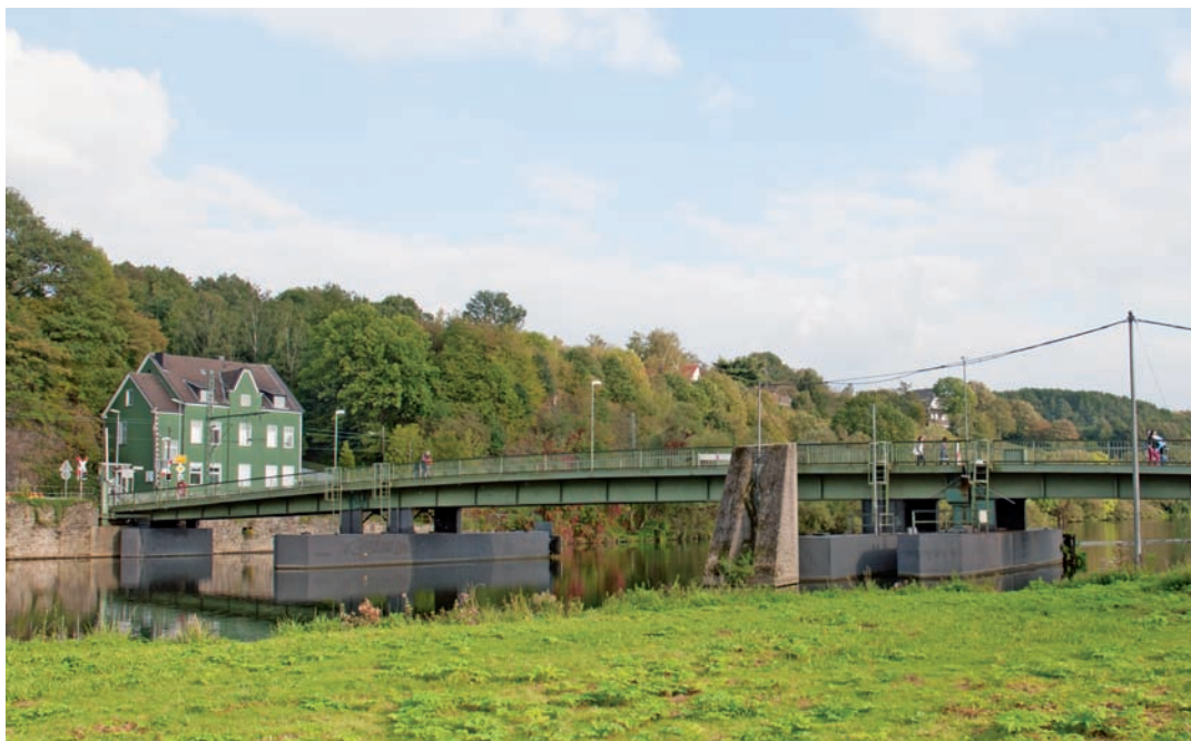
Der Stein des Anstoßes: die Pontonbrücke in Dahlhausen.

Im Streit um die Pontonbrücke sind sich die drei beteiligten Städte bisher nur in einem Punkt einig: Die Brücke muss offen bleiben. Der Ennepe-Ruhr-Kreis ist zwar alleiniger Eigentümer des Bauwerks, teilt sich jedoch mit der Stadt Bochum die Unterhalts- und Instandhaltungskosten. „Für uns kam diese Nachricht sehr überraschend, da die Brücke nicht akut baufällig ist“, teilt ein Sprecher des Ennepe-Ruhr-Kreises mit. Dennoch zeigte er sich optimistisch, eine Lösung zu finden „und wir sind natürlich offen für Ideen“. Die Essener Seite hält eine Vollsperrung für übertrieben. Die Stadtverwaltung Essen und die Bezirksvertretung der Ruhrhalbinsel ziehen an einem