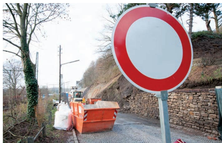
Derzeit wird an der Lewacker Straße der Hang zur Straße gesichert.

Doch bevor solche gewaltigen Dinge in Angriff genommen werden, wird 2016 erst einmal die Situation am Sonnenberg entschärft. Dort trägt die Wand die Last schon länger nicht mehr, so dass sie abgestützt werden muss. Zusammen mit dem Kanal- und Straßenbau